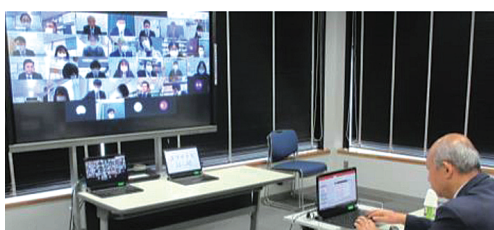
戸ヶ崎教育長による答申伝達講義

TODA Education Weeksは、令和3年度を迎えるにあたり、「令和の日本型学校教育」の構築を目指して（答申）を深く読み込んだり、戸田市立教育センター教科等研究グループの研究成果や有識者による作成動画を視聴したりして教職員及び学校間で共有することで、新学習指導要領の趣旨やこれからの時代の教育について、より一層理解を深める期間として設定した。