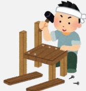
校内の補修や塗装など