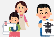
ミシン、書写等の実技支援