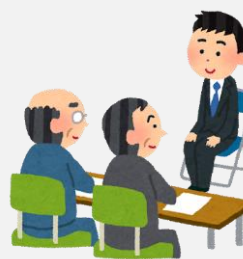
面接練習の面接官