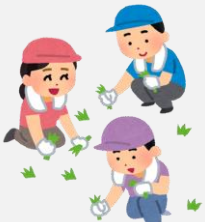
除草活動や落ち葉の掃き掃除など