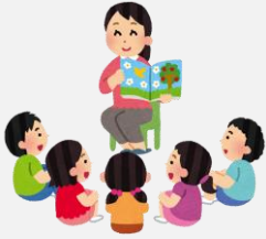
本の読み聞かせの支援