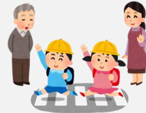
子供の登下校時の見守りやあいさつ運動の参加など