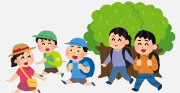
校外学習における、子供の引率補助