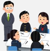
地域を学ぶ授業の支援