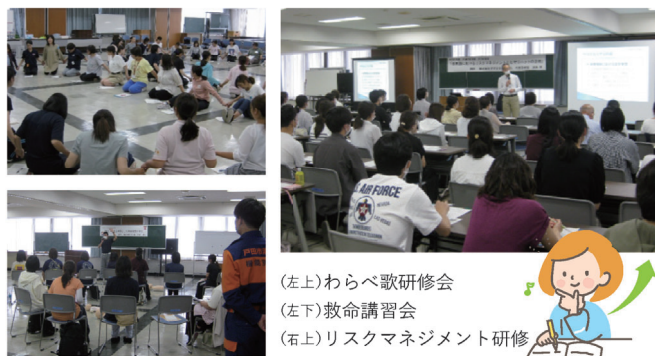
(左上) わらべ歌研修会 (左下) 救命講習会 (右) リスクマネジメント研修