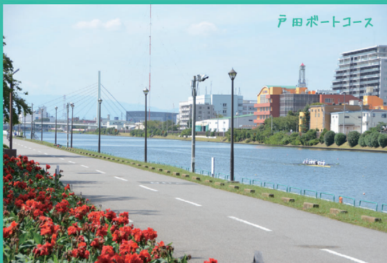
戸田ポートコース