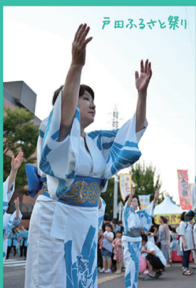
戸田ふるさと祭り