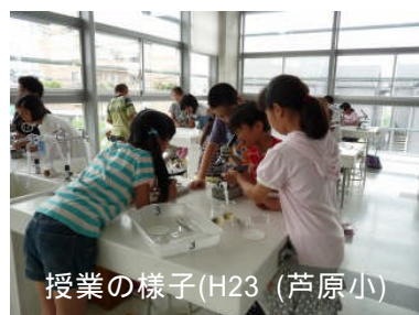
授業の様子(H23 芦原小)

彩湖自然学習センターでは、センター授業の他に、市内小・中学校への出前授業も行っています。6月は、5年生理科「メダカの食べ物」の学習で水中の小さな生物の観察を行います。センター近くの田んぼの水を学校に持って行き、顕微鏡で観察します。田んぼの水の中には、ミジンコ、ゾウリムシ、ミカツキモ、などの小さな生物がたくさん見られます。子どもたちは、初めて見るミクロの世界に興味津々。ミジンコもよく見