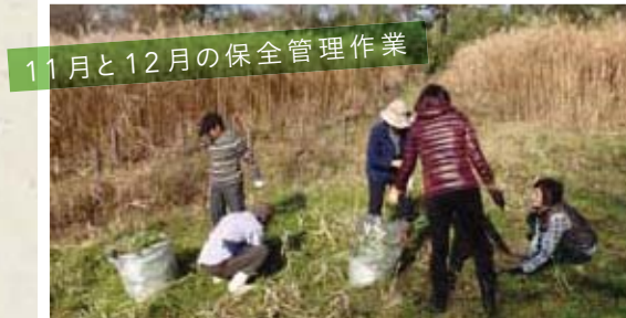
11月と12月の保全管理作業

2011年12月に戸田ヶ原自然再生エリア第1号地へ植樹したハンノキの周りの除草を行いました。植樹から2年が経ち、ハンノキは高さが2mを超えています。また、第1号地のセイタカアワダチソウやアメリカスミレサイシンなど外来植物の抜き取りも行いました。