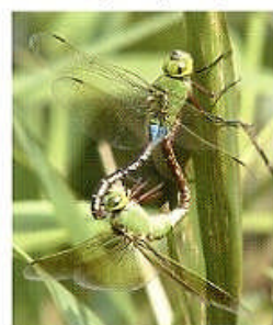
ギンヤンマのペア