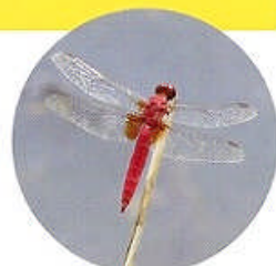
ショウジョウトンボ

8月になると、おなじみのシオカラトンボに、大型のギンヤンマが現れ、トンボ観察に最適の時期になります。トンボの雄は、なわばりを持つ習性のものが多く、近づく別のトンボを激しく追い払う動作などが観察できます。ギンヤンマのオスのなわばりは特に広く、縄張り内をバトロール飛行する姿を観察できます。