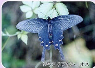
シヤコウアゲハ オス