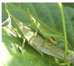
オンブバッタのペア