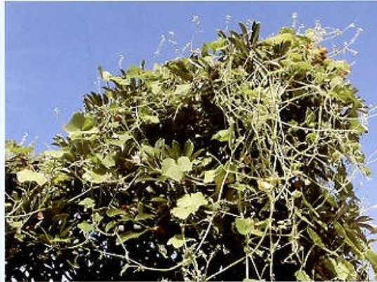
全景：マテバシイを覆い隠すアレチウリ