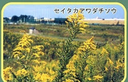
セイタカアワダチソウ