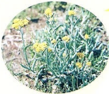
ハハコグサ (春には黄色い花を開く)