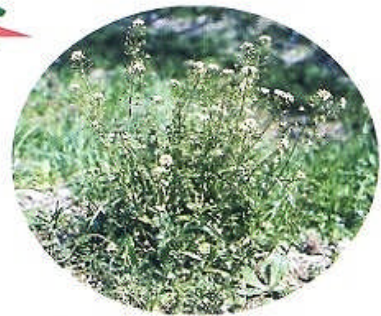
ナズナ (ベンベン草ともいわれる)

正月七日の朝、七草粥を食べる習慣は、古く室町時代から伝えられた行事の一つと言われています。