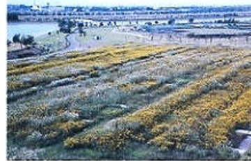
黄色と白の縞模様

彩湖の周辺に黄色の帯と白色の帯が縞模様を織り成し見事な自然の彩りを展開します。これはセイタカアワダチソウとオギの群落が一斉に花穂を咲き競うためです。