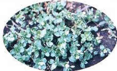
ハコベ (白い小さな花をつける)

七草粥に入れて食べる「春の七草」とは、せり(セリ)、なずな(ナズナ)、あぎょう(ハハコグサ)、はこべら(ハコベ)、ほとけのざ(コオ