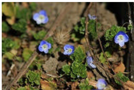
オオイヌノフグリ

センターの周りには、オオイヌノフグリやホトケノザなど春一番の野草が咲きはじめました。また、3月6日は、「啓蟄 けいちつ 」（大地が暖まり、冬眠をしていた虫が穴から出てくる頃）です。春はもう間近ですね。(T)