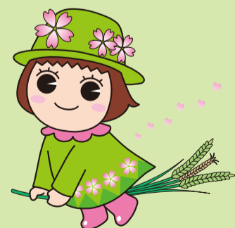
とだみちゃん 戸田ヶ原自然再生キャラクター