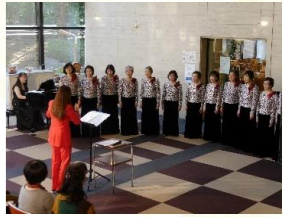
2019年2月23日(土) 出演：戸田フラウエンコール