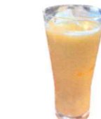
マンゴーラッシー