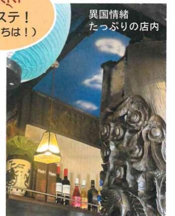
異国情緒 たっぷりの店内

戸田市本町4-17-8 電話番号: 048-278-6892 営業時間: 11:00~15:00 17:00~22:00 定休日: 木曜日