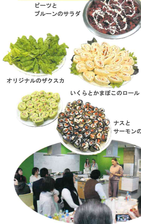
ピーツと ブルーンのサラダ