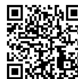
事前予約 (スマート申請)

戸田市役所 市民生活部 協働推進課 男女共同参画担当 電話:048-424-9559(直通) FAX:048-433-2200 メール:community@city.toda.saitama.jp