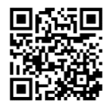
あいパル SNS 一覧