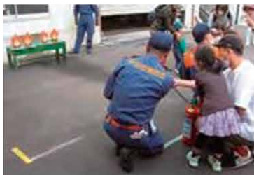
消防ファミリーデー