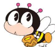
生涯学習マスコット 「マナビィ」