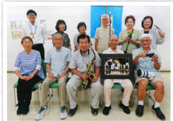
シルバー戸田 25 号は私たちが作りました (広報委員会)

シルバー人材センターでも、記事のとおり今年度から「Smile to Smile」というスマホで利用できる会員向けコミュニケーションツールの運用が始まり、また全市民向けにスマホ講座も開催しております。