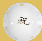
記念盃 (睦和学校開校式)