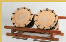
ツケ太鼓 (いしもしも3かんのんぎょう 新曾下町観音経)