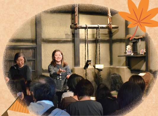
古民家おはなし会