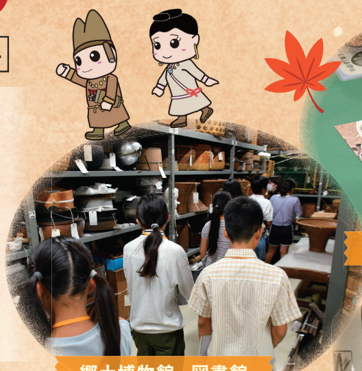
黒曜石で紙を切る体験

※イベント内容は変更になる場合があります。 イベント詳細・最新情報は博物館ホームページをご覧ください。