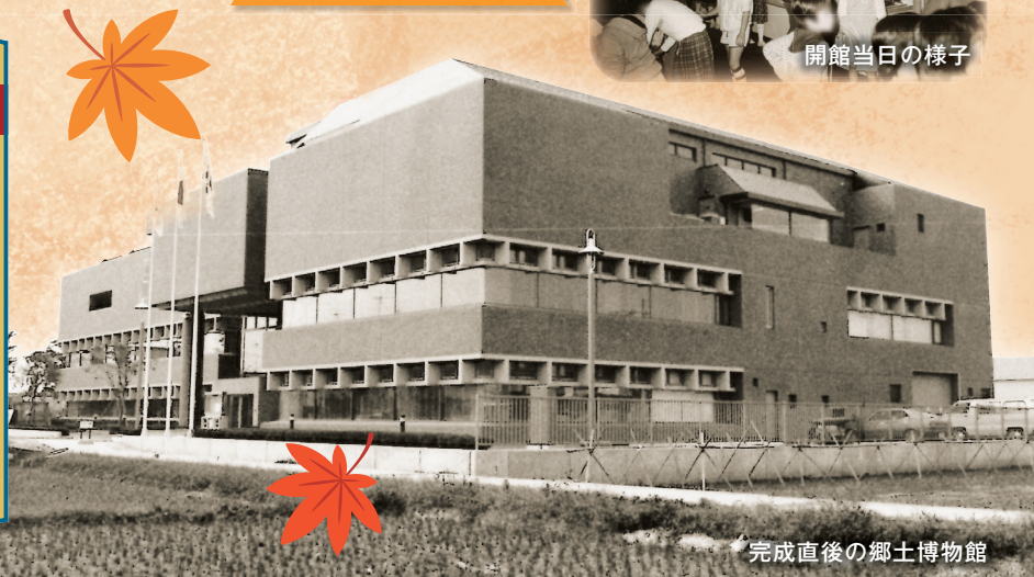
完成直後の郷土博物館