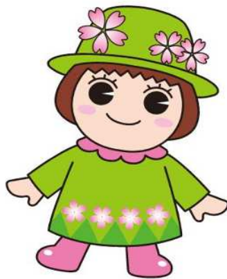
戸田ヶ原自然再生キャラクターとだみちゃん

子ども・子育て支援法が改正され、令和元年10月から幼児教育・保育の無償化が始まりました。新制度幼稚園の利用及び無償化の給付を受けるためには、戸田市から教育・保育給付認定を受ける必要があります。また、預かり保育部分の無償化の給付を受けるためには、施設等利用給付認定も受ける必要があります。この案内では、新制度幼稚園の認定・利用に関する手続や必要な書類等について重要なことを記載しています。内容をよく読んで、申請してください。