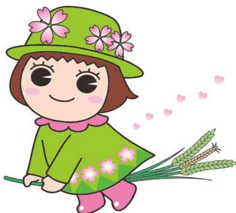
戸田ヶ原自然再生キャラクターとだみちゃん

子ども・子育て支援法が改正され、令和元年10月から幼児教育・保育の無償化が始まりました。私学助成幼稚園等を利用される方が無償化の給付を受けるためには、戸田市から施設等利用給付認定を受ける必要があります。 この案内では、私学助成幼稚園等の認定・利用に関する手続や必要な書類等について重要なことを記載しています。内容をよく読んで、申請してください。