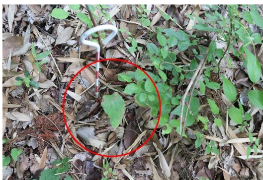
令和6年4月28日撮影 うばゆり生育状況