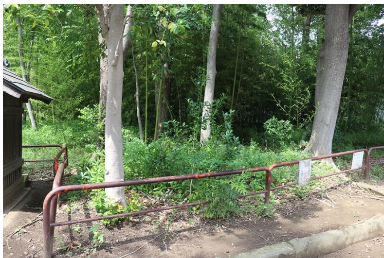
うばゆり生育範囲