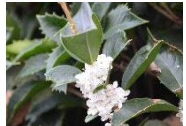
白色のヒイラギモクセイ

キンモクセイと同じモクセイ科ですが、葉っぱをみると葉のふちがギザギザの形をしています。これも雄の木しかなく種子を見る事が出来なようです。花の色は白色で、鼻を近づけると甘いバニラの香りがして私はいつまでもその場所にいたい気持ちになります。