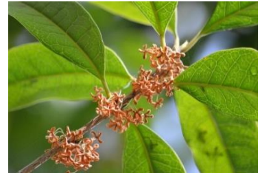
オレンジ色のキンモクセイ

キンモクセイは雄の木と雌の木とがありますが、日本には雄の木だけがあり種子は見る事が出来ません。挿し木で増やし公園や街路樹、学校、庭木として植えられています。オレンジ色の小さな花が枝いっぱい付く、秋を代表する香りの強い花です。