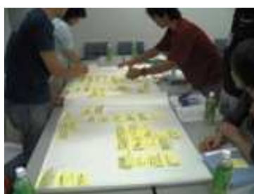
意見について簡単に説明しながら、カードを貼る