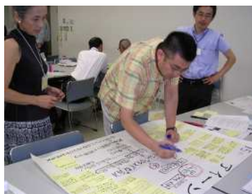
説明などを書き込む