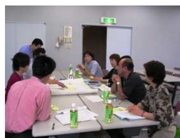
貼りだしたカードを見ながら、みんなで話し合う