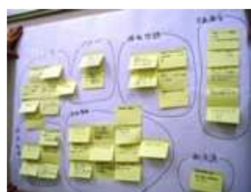
カードをグループ化し、見出しをつける