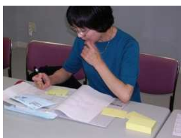
自分の意見をカードに書き出す