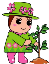
戸田ヶ原自然再生キャラクター とだみちゃん

*取消の際、保険代金はご返金させていただきます。 *本ツアーは国内旅行傷害保険に全員加入とさせていただきます。 ※追加で保険加入をご希望の方は各自でご加入をお願いいたします。(弊社でご案内も可能です)