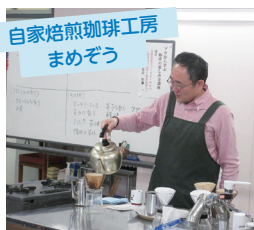
「プロから学ぶ珈琲の楽しみ方講座」