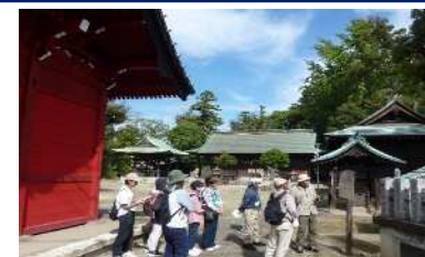
【実践】正しい歩き方で文化財めぐりウォーキング！