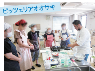
「地元人気店のシェフが教える夏のイタリア料理」

今回紹介した講座以外にも、魅力的な講座が盛りだくさん！自分のペースで受講し、学びや経験を深めていくことができます。詳しくは市ホームページや冊子「戸田市民大学カリキュラム」、『広報 戸田市』情報ガイド欄をご覧ください。