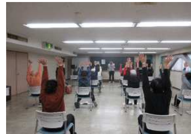
【実践】NHKテレビ体操指導者による本気のラジオ体操講座