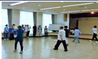
【講義+実践】正しい歩き方を知ろう！(講師:健康運動指導士)