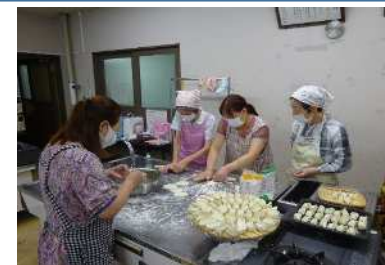
【体験】中国料理(水餃子) をつくる・食べる！