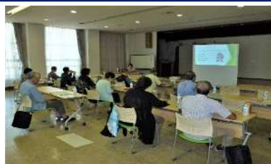
【講義】「歩いて健康になろう！」 (講師:保健師)

保健師による歩くことの大切さ、健康運動指導士による正しい姿勢、歩幅等を学び、実践として地域を歩きました。 受講者数 15名