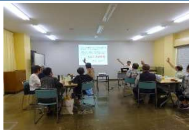
【講義】多文化共生とは？

講義や体験、中国出身の方との交流を通じて、日本と中国の相互の違いや良さを学びました。 受講者数 9名