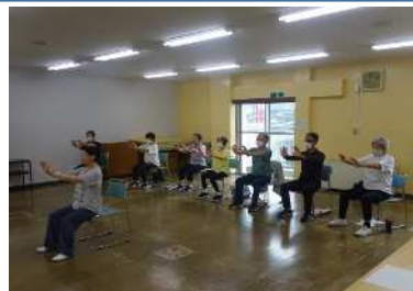
【体験】中国伝統健康法 「太極拳」にチャレンジ