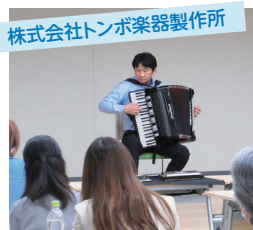
「地元企業トップに聞く仕事術」