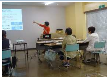
【講義】日本とは違う？ 中国の文化や言語、生活