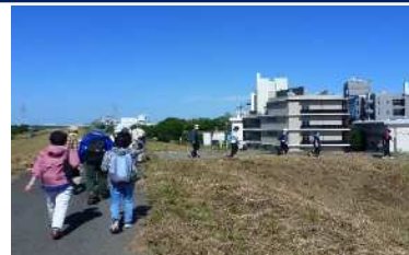
【実践】正しい歩き方で市内ウォーキングコースを歩こう！