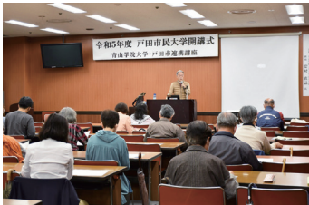
青山学院大学・戸田市連携講座 「ジェンダーと学問研究」