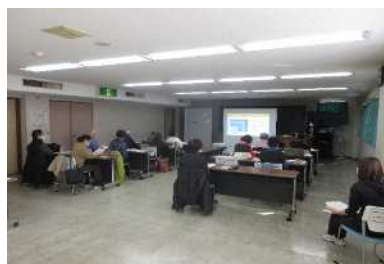
【講義】健康と運動の関わりについて学ぶ。(講師:保健師)

保健師の講義と体操指導者による実技により健康づくりのポイントとなる食事や習慣的な運動について学びました。 受講者数 15名