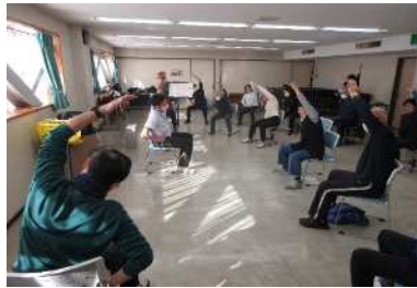
【実践】自宅でも簡単にできるストレッチ・筋トレ(講師:保健師)