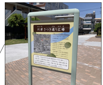
制札板 (名称、説明、注意事項)