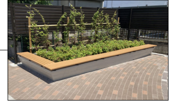
ベンチ兼植栽柵 中木、低木