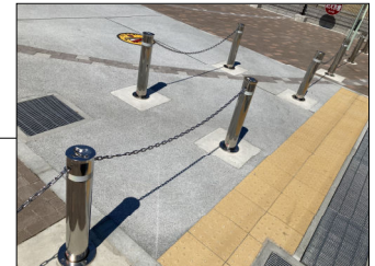
車止め (上下式) 誘導ブロック