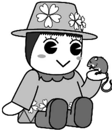
戸田ヶ原自然再生キャラクターとだみちゃん

子ども・子育て支援法が改正され、令和元年10月から幼児教育・保育の無償化が始まりました。新制度幼稚園の利用及び無償化の給付を受けるためには、戸田市から教育・保育給付認定を受ける必要があります。また、預かり保育部分の無償化の給付を受けるためには、施設等利用給付認定も受ける必要があります。この案内では、新制度幼稚園の認定・利用に関する手続や必要な書類等について重要なことを記載しています。内容をよく読んで、申請してください。