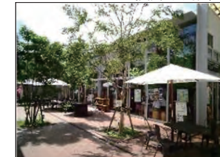
オープンスペース化