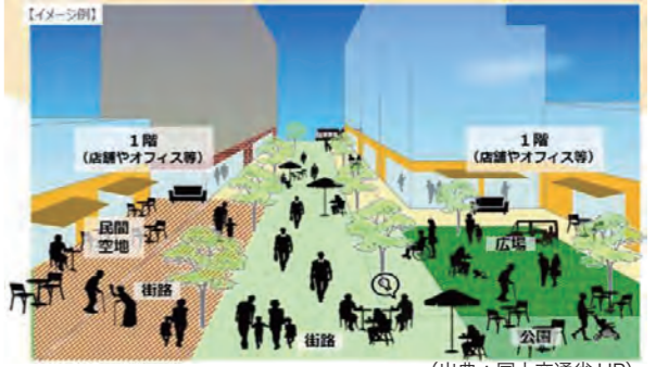
図2：【ウォーカブル空間形成のイメージ】

北戸田駅周辺地域の「ウォーカブル空間形成」は、北戸田駅西口の「新曽第一土地区画整理事業」や「都市再生整備計画」**と関係づけながら検討を進めていきます。