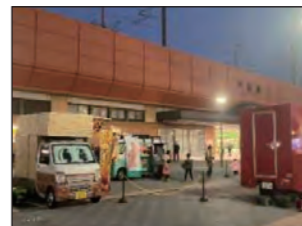
戸田駅西口キッチンカーイベント