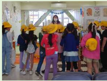
親子ふれあい広場