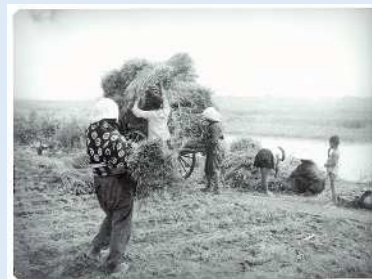
増水後の荒川堤外での麦刈り

戸田市立郷土博物館研究紀要第32号2024 p.34-49 佐藤勝巳「戸田市史」を読む(1) - 「美女木村」を題材として -