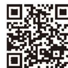
認証キーの取得方法 発注者への提出方法