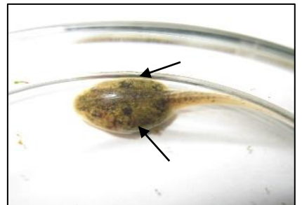
オタマジャクシは黒い2つの点が目印