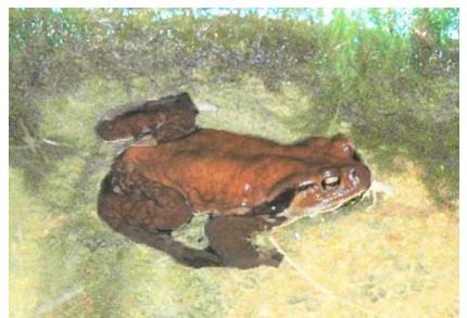
アズマヒキガエル