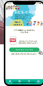
ヤギのいる学校 (笹目小学校)