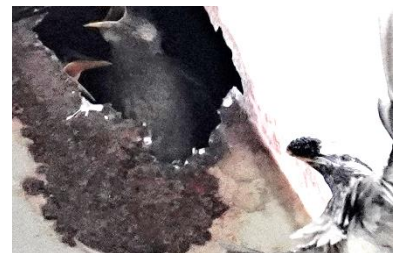
ヒナにクワの実を運ぶムクドリ。ちゃんと黒い実を与えていた。ヒナの糞は親が遠くに捨てに行く