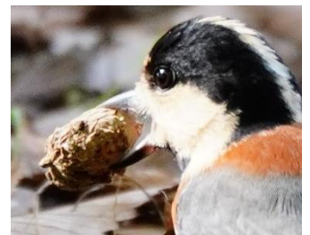
ハクウンボク(エゴノキの仲間)の実をくわえるヤマガラ。蓄食するのだろうか