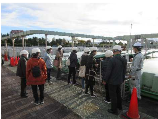
【前年度の講座風景】令和4年11月24日(木)撮影