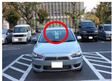
(車内での掲示例) 外から利用証が見えるように 掲示します。