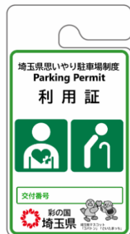
その他障がい者、 要介護者等用