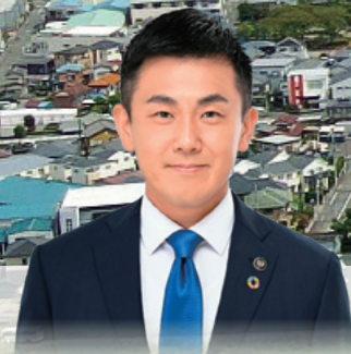
戸田市長 菅原 文仁

人口 …… 142,131人 (R5.6.1現在) 世帯数 …… 68,927世帯 (R5.6.1現在) 面積 …… 18.19km 2 市制施行 …… 昭和41年10月1日 職員数 …… 968人 (R5.4.1現在) (特別職・再任用短時間職員を除く)