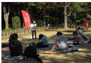
<健康教室でのミニ講話>