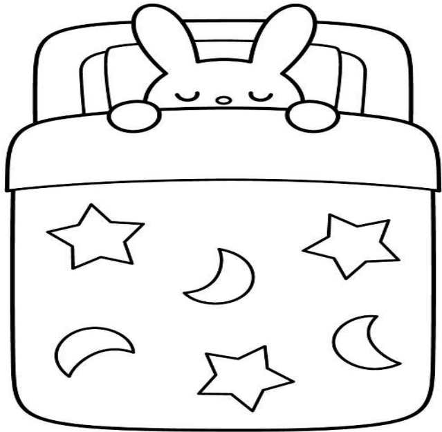
病児保育室 太陽の子北戸田