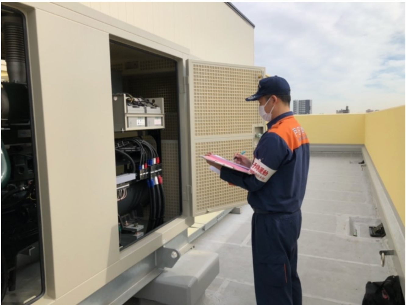
防火対象物の竣工検査の様子