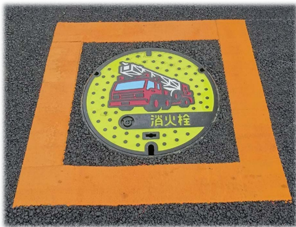
市内 消防水利施設の整備（消火栓丸蓋）