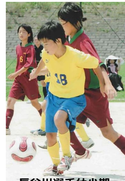
長谷川選手幼少期