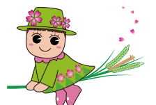
戸田ヶ原自然再生キャラクター とだみちゃん