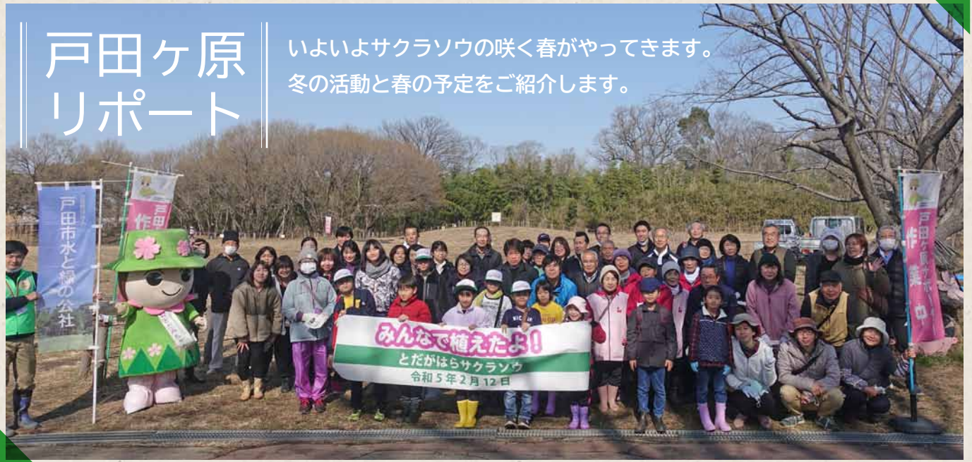
戸田ヶ原さくらそう植え付けイベント 2023