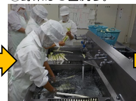
⑤コンテナに入れる。