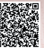
「つばさ」バックナンバー