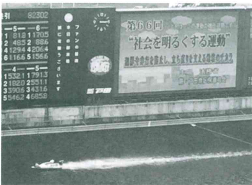
ポートルース戸田の電光掲示板による啓発活動

ない幸福な社会を願うシンボルマーク)を胸に付け、市長・福祉部長・次長・福祉総務課の職員・戸田市暴力排除推進協議会・戸田更生保護女性会など多くの皆様の御協力をいただき、実施する事が出来ました。