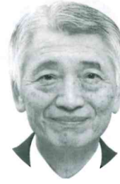
蕨・戸田地区保護司会