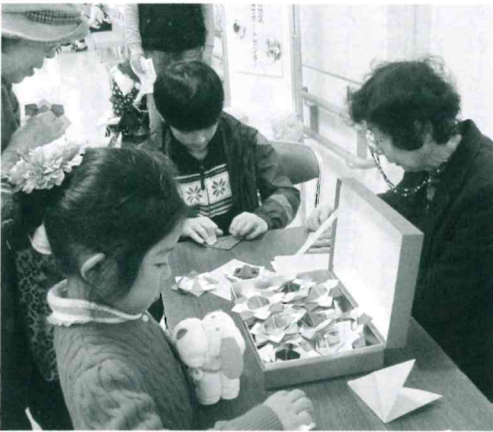
子どもたちとこま作り

・同一事件で数人の保護司により保護観察を持っている場合、保護司同士で情報交換しています。 ・戸田・蕨更生保護女性会でそれぞれに打ち合わせに使用しています。 ・ミニ研修（隔月開催）、参加者は少ないのですが内容の濃い研修です。 ・戸田市健康福祉まつりへの参加、他の機関との交流と保護司会を知って貰う為の広報活動をしています。 ・健康福祉まつり準備の為、10数人で折り紙のこま作りをしています。 ・3、4名の保護司で自主研修に使用しています。