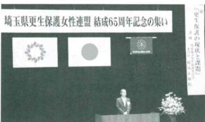
埼玉県更生保護女性連盟 結成 65 周年記念の集い