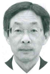
蕨市健康福祉部長