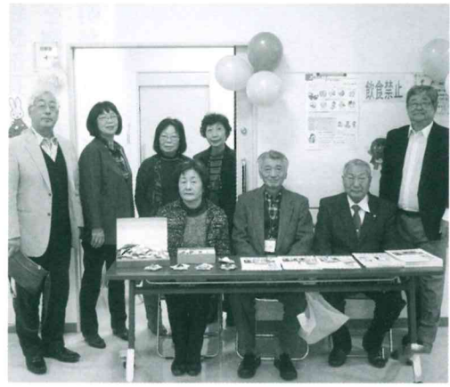
保護司会ブースの前で