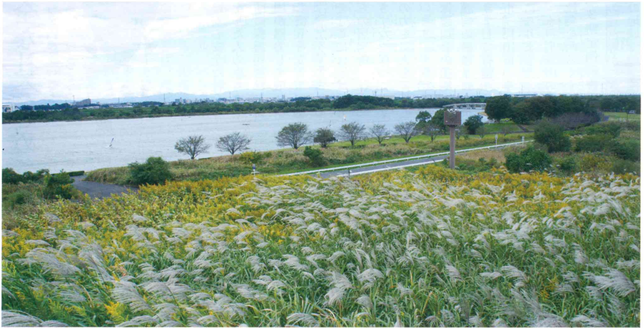
戸田ヶ原から彩湖をのぞむ

「蕨・戸田地区保護司会だより」の第4号の発刊にあたり、挨拶申し上げます。皆様には日頃より広く社会に更生保護の心を伝え、地域に更生保護の土壌を創りあげるために、多大なる御尽力をいただいております。深甚なる敬意を表すとともに、心より感謝を申し上げます。 近年、私たちを取り巻く社会環境は著しく変化し、犯罪や非行は年々深刻になっており、東松山市で発生した少年事件など、痛ましい事件があつたとを絶たず憂慮すべき状況にあります。 また、学校、家庭、地域社会等における人間関係の希薄化、連帯意識の低下などで少年犯罪の多発化との関連を指摘する声もあります。 このような課題に直面している今日、対処療法的な取組だけでなく、犯罪を生まない、安心安全な地域づくりや、誰もが夢や希望をもち、互いに力を合わせ、支え合っている取組が、これまでも増して必要であると考えます。