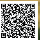
「つばさ」バックナンバー