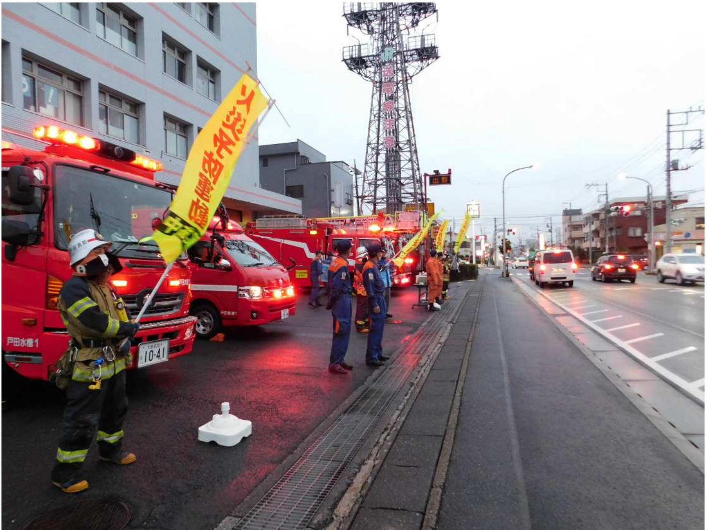
全国秋季火災予防運動 広報活動