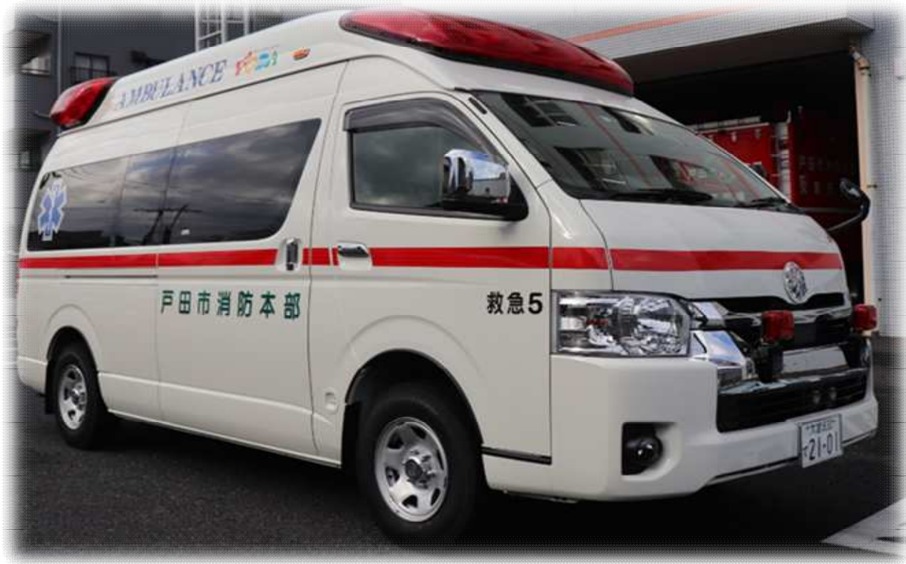
令和3年度購入車両 新救急5号車