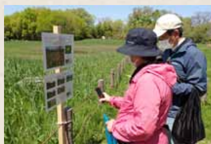
スマホで動画を見られるようにしました