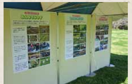
市民や戸田ヶ原サポーターの活動の紹介