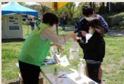
クイズラリーの参加賞として先着 50 名にサクラソウポットをプレゼント