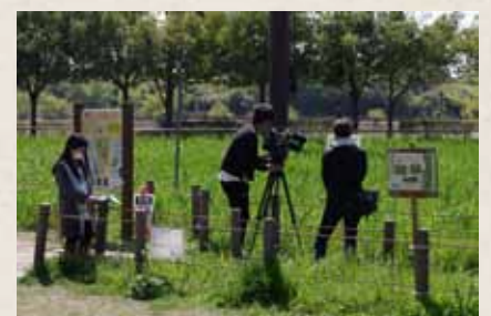
テレビ局も取材に来ました