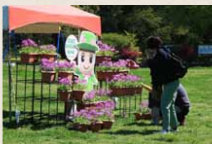
とだみちゃん記念撮影コーナー