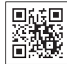
QR code “Corona vắc-xin navi”